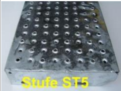
Ablauf, 3. Szene: <auf der Treppenstufe abrutschen>