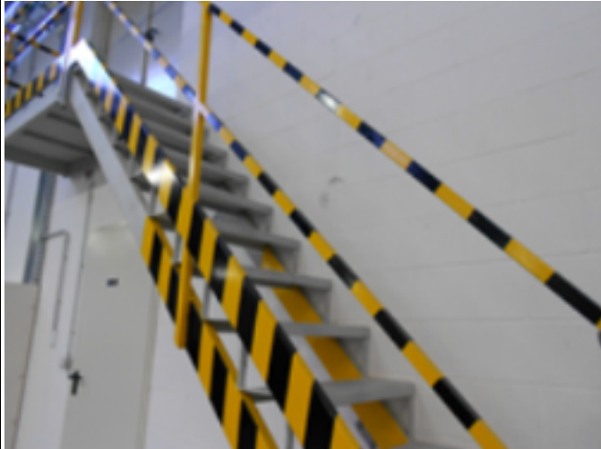
Ablauf, 1. Szene: <Lagerhalle betreten>