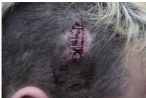
Primär Verletzung: <Platzwunde am Kopf>